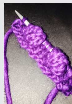
Två färdiga muscher.

Sticka 5 m i samma m, växelsvis i den främre och den bakre maskbågen. Vänd, sticka 5 aviga, vänd, sticka 5 räta, vänd, sticka